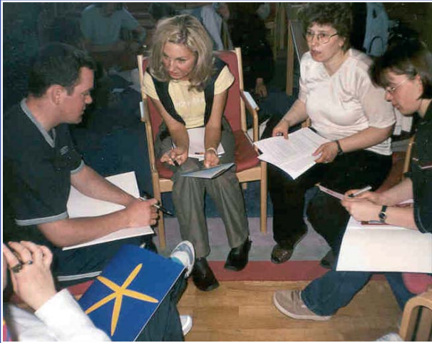
Los participantes en la reunión temática de experiencia directa en la utilización de técnicas inter pares para la prevención del uso indebido de drogas.